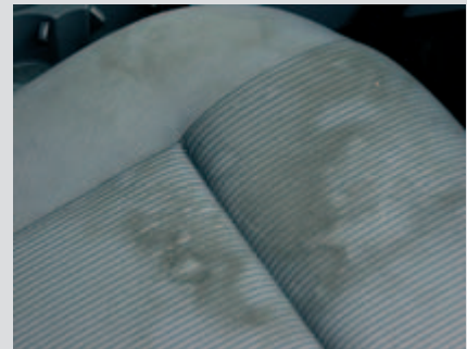
Macchie estese sul sedile non removibili tramite una normale pulizia.