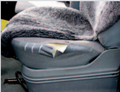
I rivestimenti sono strappati o manca del tessuto dall'imbottitura.