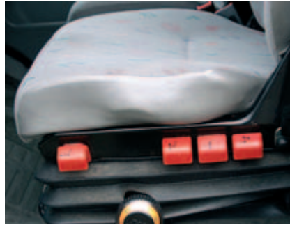
Un altro esempio di usura accettabile.