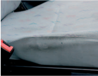
Sedili che mostrino l'usura conseguente ad un normale utilizzo.