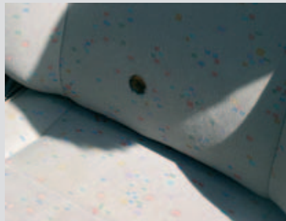
Imbottiture strappate o bruciature da sigaretta.